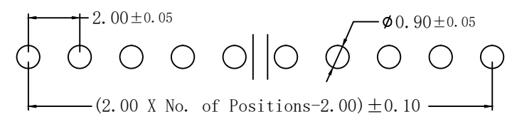
Recommended PCB Layout

接触材料 (Contact Material): 黄铜(Brass) 塑胶材料 (Insulator Material): 尼龙(Nylon)-9T, UL 94V-0; 颜色: 黑色 接触电镀 (Contact Plating): 镀金 (Gold plated) (电镀规格可根据客户要求来定制) Opitonal planting on request.